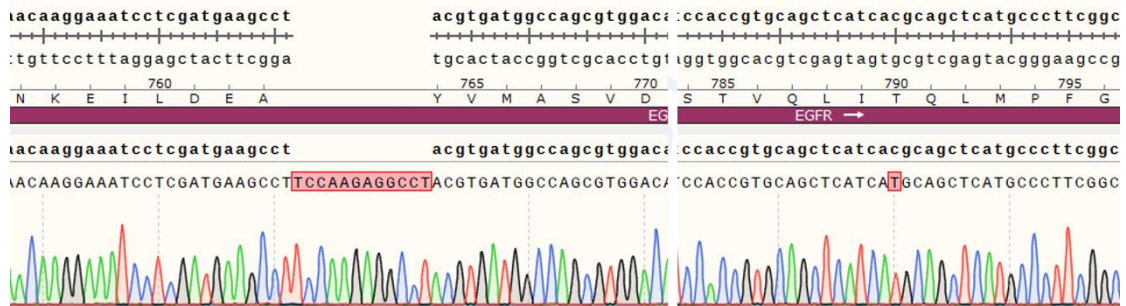
Fig 3. H_EGFR(A763-Y764insFQEA-T790M) BAF3 Cell Line 测序结果